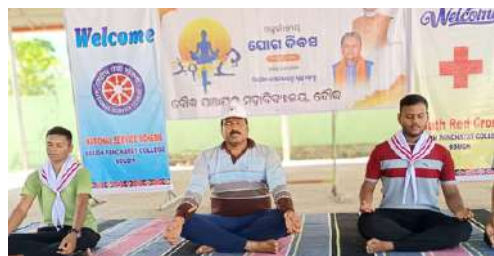
International Yoga Day celebration by Youth Red Cross of Boudh Panchayat College, Boudh, Odisha