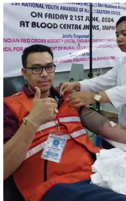
Blood donation camp Thoubal District Branch, Manipur

"EMPATHY IN ACTION: WHERE EVERY DONATION BECOMES A LIFELINE." - INDIAN RED CROSS SOCIETY