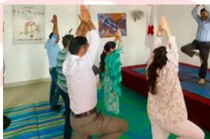
International Yoga Day celebration at IRCS Jammu and Kashmir state branch