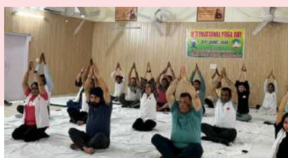
International Yoga Day celebration at Chandigarh, IRCS Punjab state branch