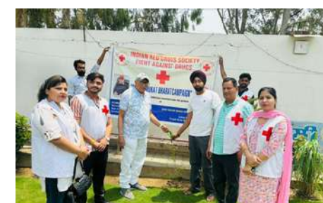
IRCS Punjab state branch observes World Environment Day