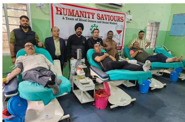
Blood donation camp, Bokaro, Jharkhand