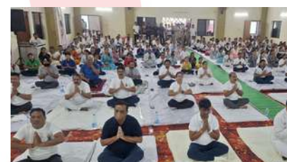
International Yoga Day celebration at IRCS Balod, Chhattisgarh state branch