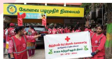
IRCS Coimbatore district branch, Tamil Nadu observes World Environment Day