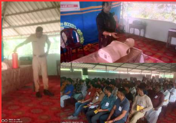
Disaster management and first aid training was held by IRCS Kerala state branch & I.A.G. Wayanad at Little Flower School, Mananthavadi