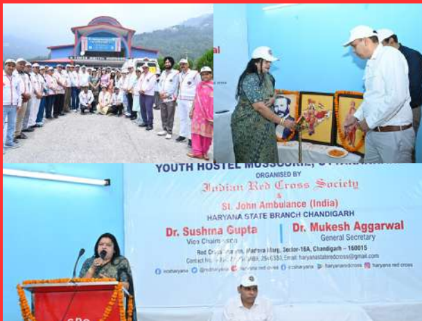
First aid training organized by Indian Red Cross Society Haryana state branch at Chandigarh