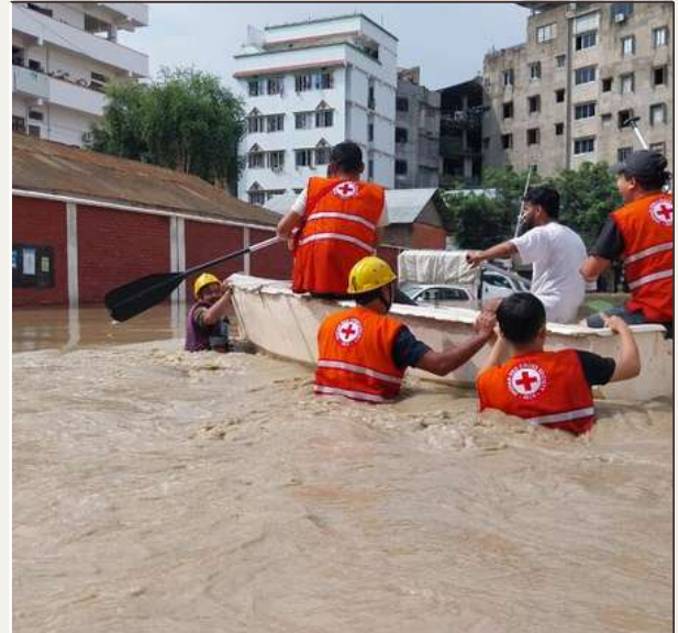
IRCS MANIPUR RESCUE TEAM MEMBERS IN ACTION DURING A FLOOD EMERGENCY

DURING A RECENT FLOOD EMERGENCY, THE ENERGETIC RESCUE TEAM OF THE INDIAN RED CROSS SOCIETY (IRCS) MANIPUR DEMONSTRATED REMARKABLE DEDICATION AND RESILIENCE. DESPITE THEIR OWN OFFICE BEING FLOODED, THE COMMITTED MEMBERS OF IRCS MANIPUR REMAINED UNDETERRED AND CONTINUED THEIR CRUCIAL WORK. THEY TIRELESSLY EVACUATED PEOPLE FROM THE AFFECTED AREAS, REACHING EVEN THE MOST INACCESSIBLE LOCATIONS. UTILIZING BOATS FOR RESCUE OPERATIONS, THEY PROVIDED ESSENTIAL SUPPLIES TO THOSE IN NEED. THE TEAM DISTRIBUTED TARPAULINS TO CREATE MAKESHIFT SHELTERS AND HYGIENE KITS TO ENSURE PROPER SANITATION, PRIORITIZING THE WELL-BEING AND SAFETY OF THE AFFECTED INDIVIDUALS. THEIR UNWAVERING SPIRIT AND COMMITMENT OF HELPING OTHERS DURING THIS CRISIS EXEMPLIFY THE CORE VALUES OF THE INDIAN RED CROSS SOCIETY.