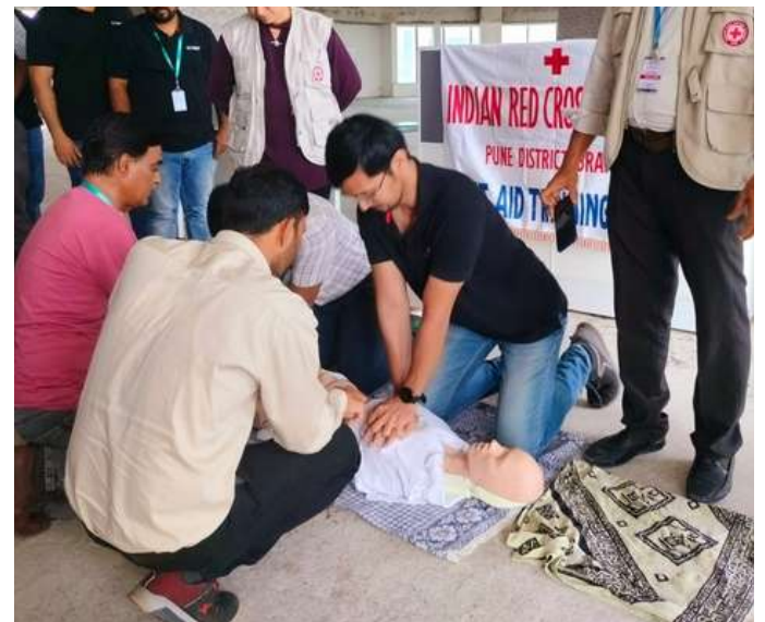
First Aid Training was held by IRCS Pune district branch for the employs of Citec Engineering India Pvt Ltd