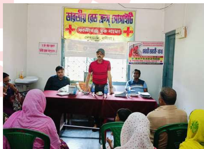
A Thalassemia Detection Camp was held at Debagram Red Cross Bhawan, organized by the district branch and executed by the Thalassemia Control Unit of Sadar Hospital, Krishnanagar, Nadia district, West Bengal. 85 people participated in the camp.