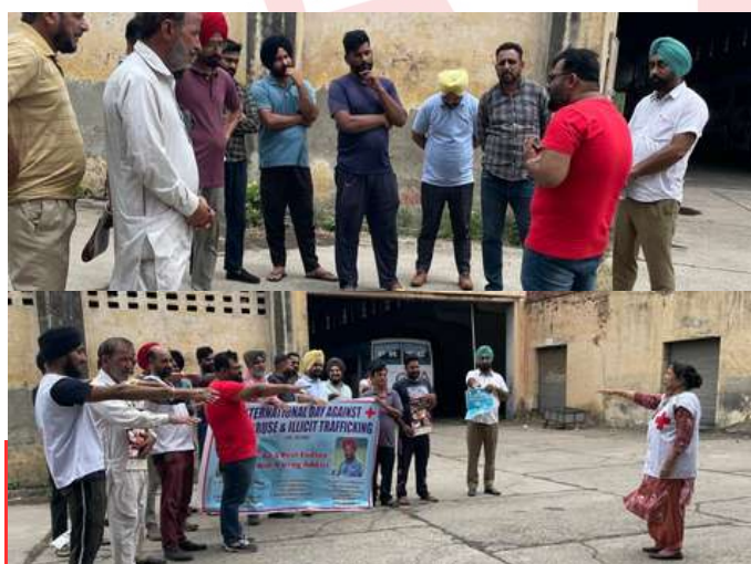
IRCS Punjab state branch Drug De-addiction and Rehabilitation Centre Patiala organized a special awareness lecture for the truck drivers at the Truck Union in Patiala