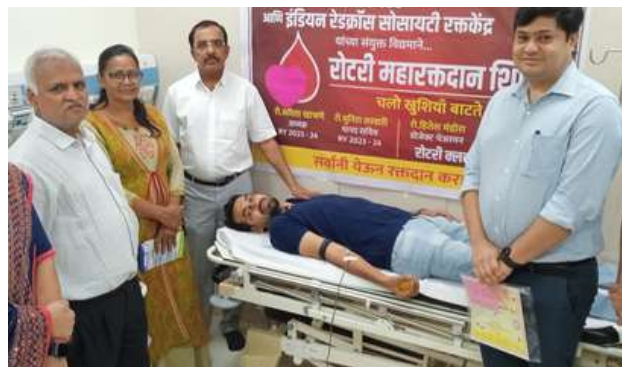
Blood donation camp, Jalgaon, Maharashtra