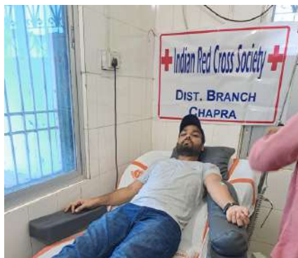
Blood donation camp, Chapra Bihar