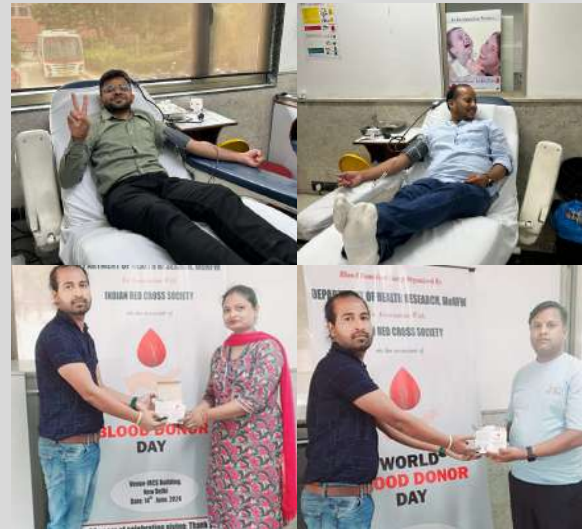
Blood donor camp conducted by Department of Health Research at Red Cross, Blood Centre