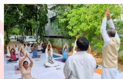
International Yoga Day celebration at Hyderabad, IRCS Telengana state branch