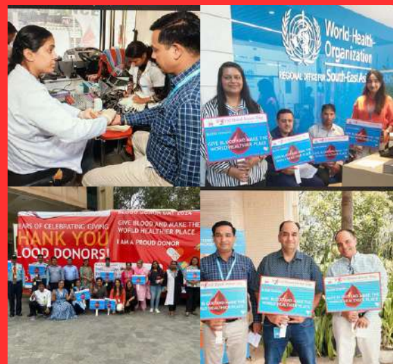
WHO, Metropolitan Hotel Office Block, Bangla Sahib Road, Gole Market, Sector 4, New Delhi