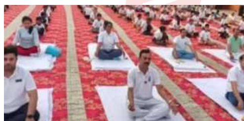
International Yoga Day celebration at Pundari district branch, Haryana