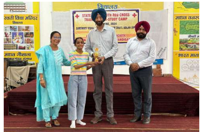
IRCS Punjab state branch organized state level youth Red Cross training cum study camp at Saraswati Vidya Mandir Gankiser, District Solan, HP.