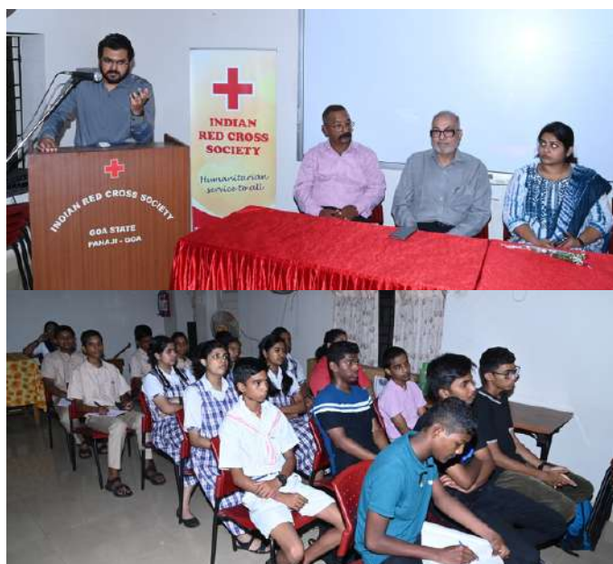
The Indian Red Cross Society, Goa State Branch, organized a Drug Abuse Awareness talk.