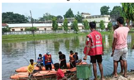
IRCS Tripura state branch observes World Environment Day