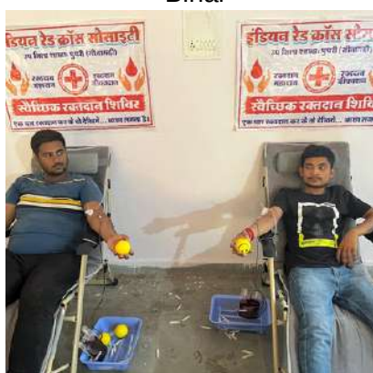
Blood donation camp, Pupri, Bihar

"EMPATHY IN ACTION: WHERE EVERY DONATION BECOMES A LIFELINE." - INDIAN RED CROSS SOCIETY