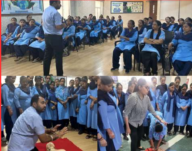
IRCS Punjab state branch conducted a first aid training program for the bus attendants of Delhi Public School, Sec-40C Chandigarh.

"COMPASSION KNOWS NO BOUNDARIES. TOGETHER, LET'S HEAL HEARTS AND RESTORE HOPE." - INDIAN RED CROSS SOCIETY