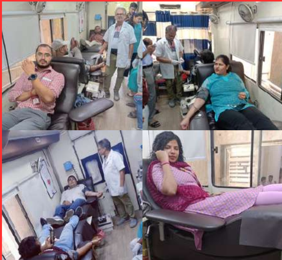
India Post Payments Bank, Corporate, Office Gole Market, New Delhi