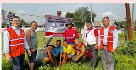
IRCS Imphal East District Branch, Manipur observes World Environment Day