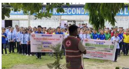
World Environment Day celebration at IRCS Udalguri, Assam