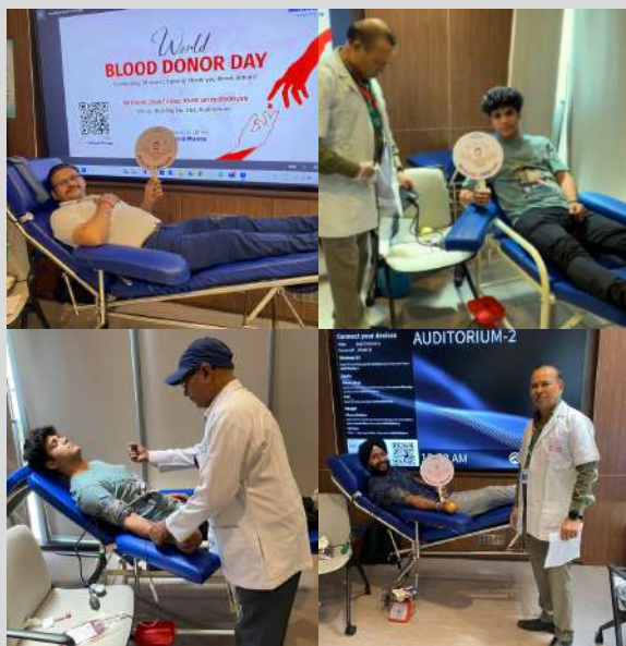
Mankind Pharmaceuticals Pvt. Ltd. Okhla, New Delhi