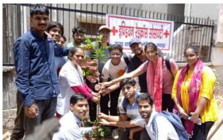
IRCS Jaipur district branch, Rajasthan observes World Environment Day