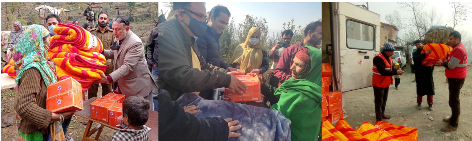
Distribution of hygiene kits & blankets by Jammu & Kashmir, UT branch