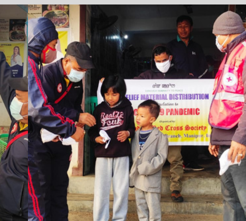
Distribution of masks amongst farmers, children & other vulnerable people at Imphal East, Manipur