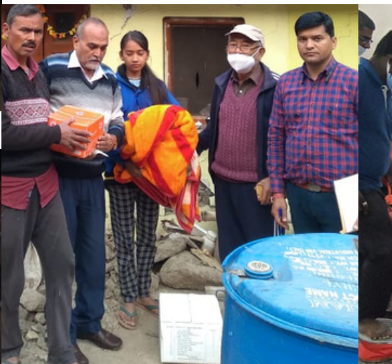
Distribution of relief materials to the disaster affected families of Nainital, Uttarakhand