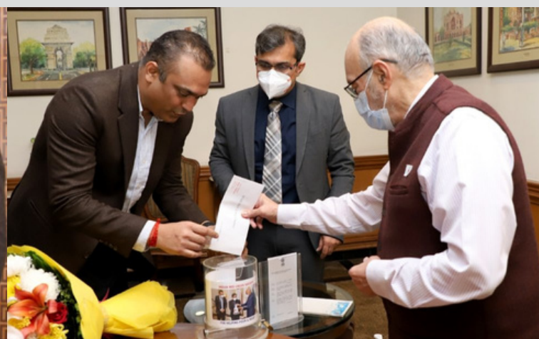
On the occasion of Red Cross Flag week a flag was pinned & the donation was also collected from LG Delhi (President of NCT Delhi Branch) by the delegation of IRCS, Delhi Branch