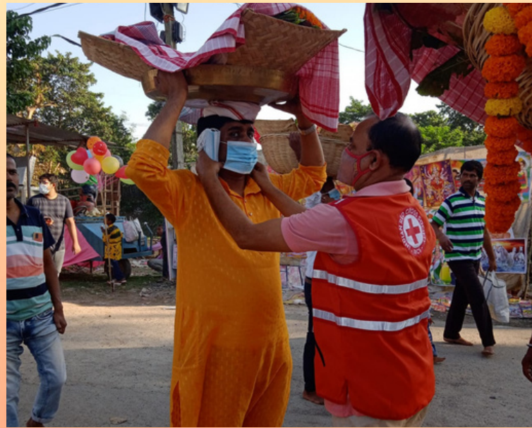
Distribution of masks at Chhath puja ghat, IRCS, Uttar Dinajpur district branch, West Bengal