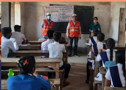
COVID-19 awareness campaign was organised by IRCS, Kandi S.D Branch, Murshidabad, West Bengal.