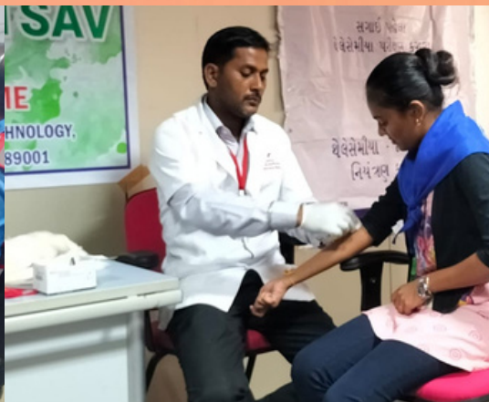
Thalassemia screening at college of Agricultural Engineering & Technology, Godhra, IRCS, Gujarat state branch.