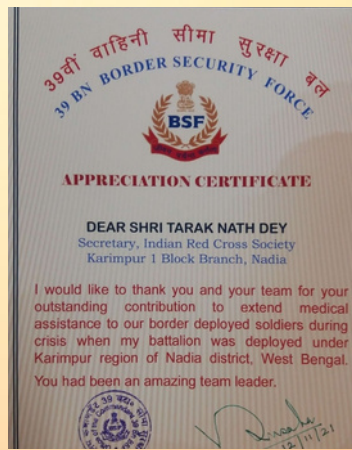
Border Security Force honored Honorary Secretary, IRCS Karimpur, West Bengal for their commendable job with BSF during COVID 19 pandemic