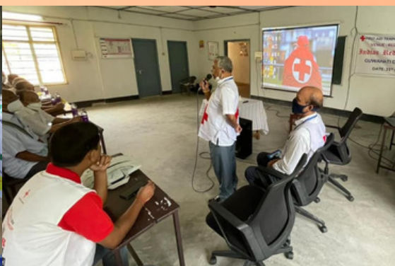
A first-aid orientation camp was organised for the senior citizens, Chandmari, Assam