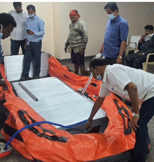
Rescue boat prepositioned by RC Volunteers for rescue works, Tamil Nadu

We are grateful to all our Donors and Volunteers for their generous support for IRCS relief efforts on behalf of millions of underprivileged and vulnerable families struggling to survive in the aftermath of the COVID-19 Pandemic. Thank you for your compassion, patience, and contribution.