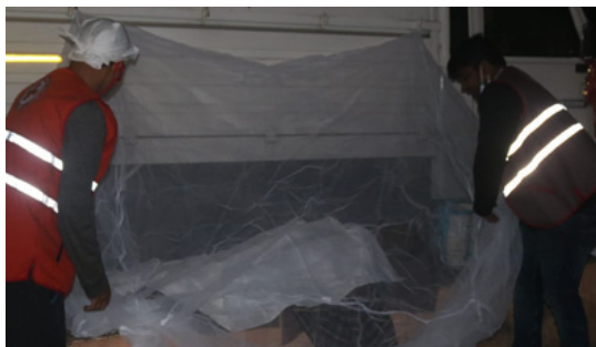
IRCS OSB spreads warmth among the less privileged people