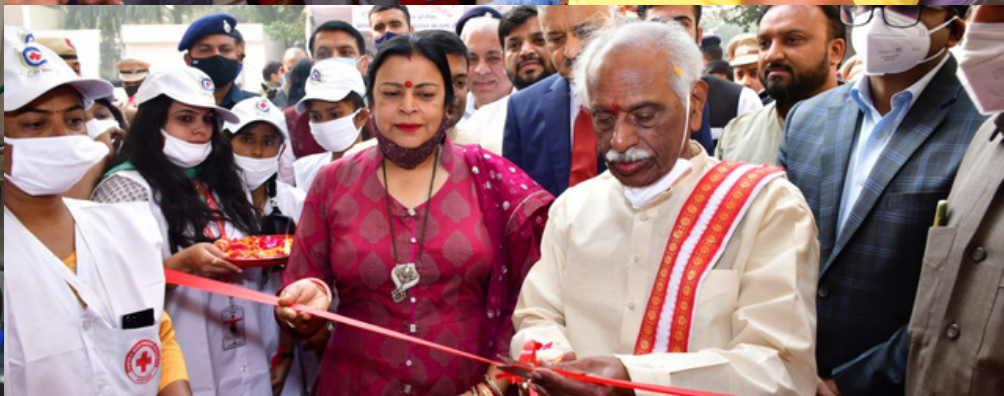
Hon'ble Governor of Haryana and President of the state branch Sh.Bandaru Dattatreya inaugurated a blood donation camp at Gurugram, Haryana, & encouraged blood donors as well.