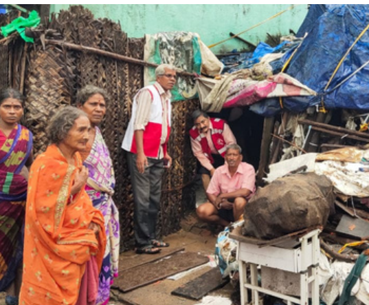
Distribution of relief material, Bahour, Puducherry