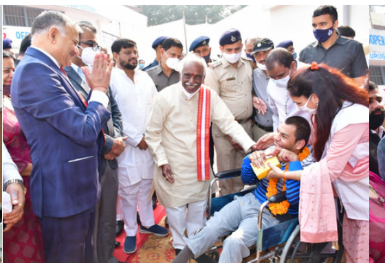
Hon'ble Governor of Haryana distributed wheel chairs among Divyangs & sewing machines to poor women.