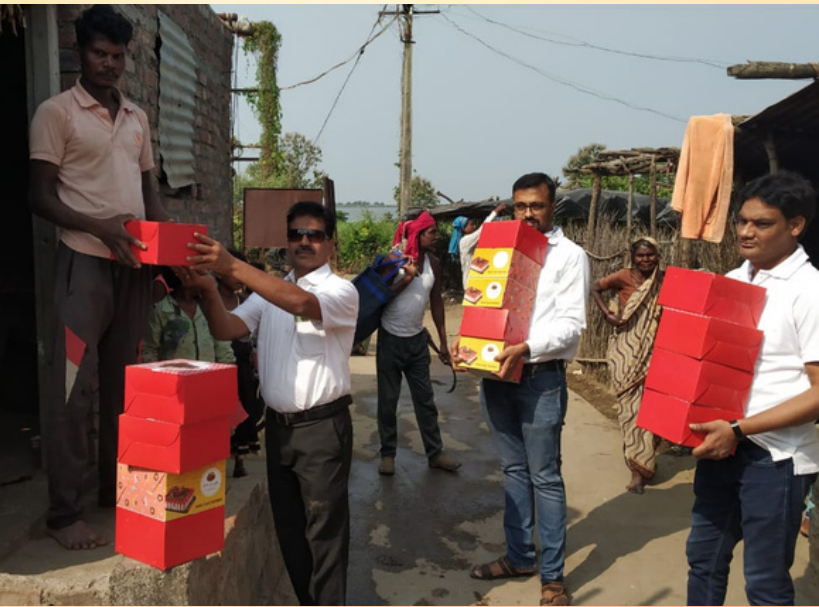
On Diwali IRCS, Savangi paud village, Maharashtra distributed sweet boxes, clothes and sweaters.