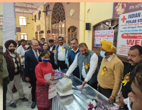
3rd Health check-up and screening camp was organized by Punjab Red Cross branch