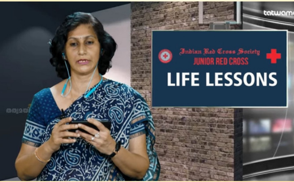
Fortnightly web channel program for JRC cadets was launched in vernacular language, Kerala