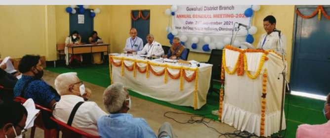
AGM of IRCS, Guwahati district branch was held on 21st Nov, at Red Cross Hospital Auditorium, Chandmari, Guwahati