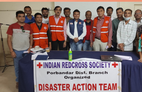
Disaster Action Team (DAT) was formed with the support of IRCS, Gujarat state branch at Porbandar district branch to provide technical support & guidance to the volunteers.