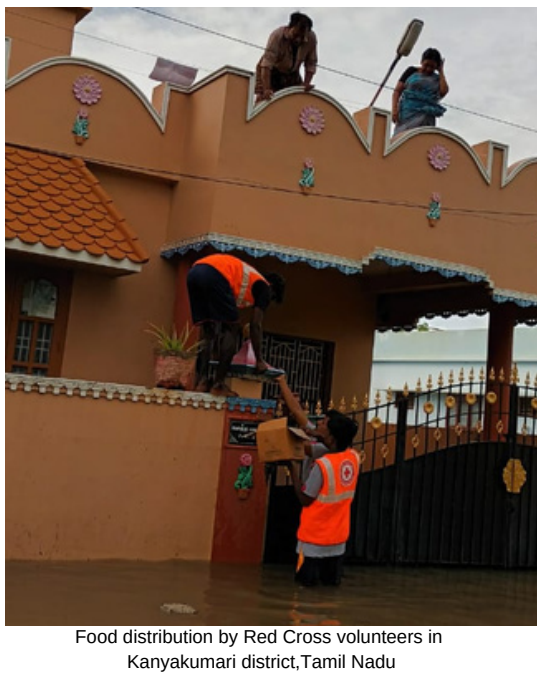
Food distribution by Red Cross volunteers in Kanyakumari district, Tamil Nadu