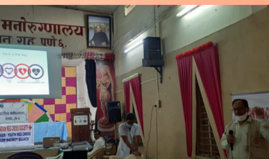
First Aid Orientation program and distribution of masks was held at Mental Hospital Yerawada, Pune, Maharashtra