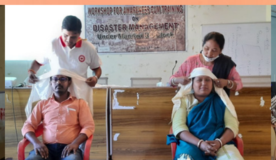
Community level awareness programme on Disaster Management at BAC hall of Mandai RD Block, Jirania, Tripura West