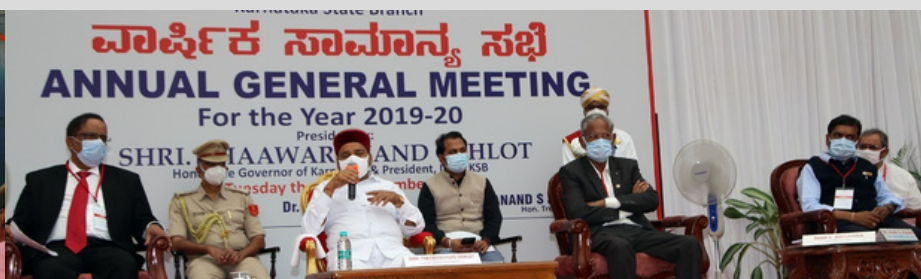
IRCS, Karnataka State Branch, held its 2019-20 AGM on 30th Nov, 2021, at Glass House, Raj Bhawan, Bengaluru, Karnataka