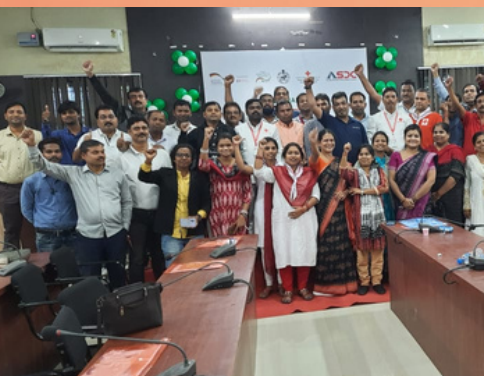
Under project Rakshak hand holding session took place after TOT programme at Koraput, Balasore, Sambalpur & Phulbani at Odisha.