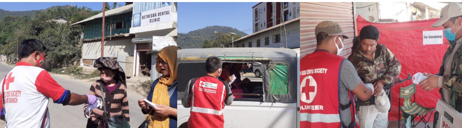
Distribution of masks by Red Cross volunteers, IRCS, Manipur