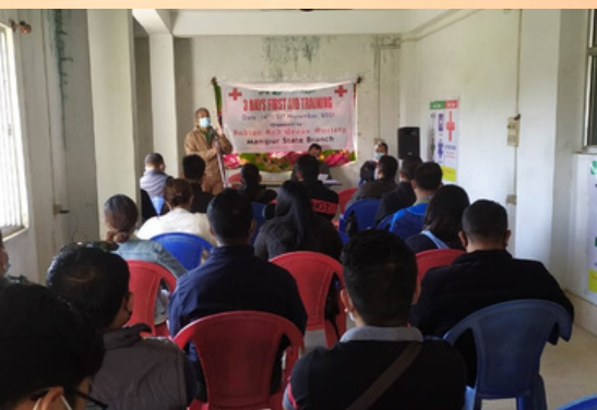
First aid training, Manipur state branch