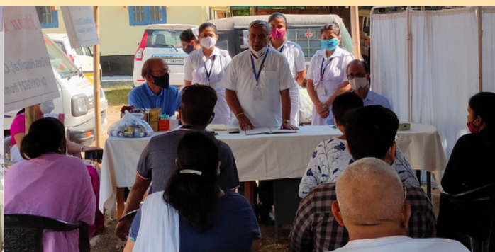
Free Health Check Up camp was organised by IRCS, Guwahati district branch