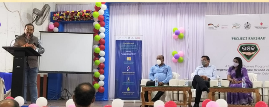
RAKSHAK training of the trainer, Road Safety Program, Govt. of Odisha was held at Phulbani for two days. The participants were from Boudh, Kandhamal & Nayagarh districts of Odisha. It aimed at reducing the death rate by 25% in road accidents.