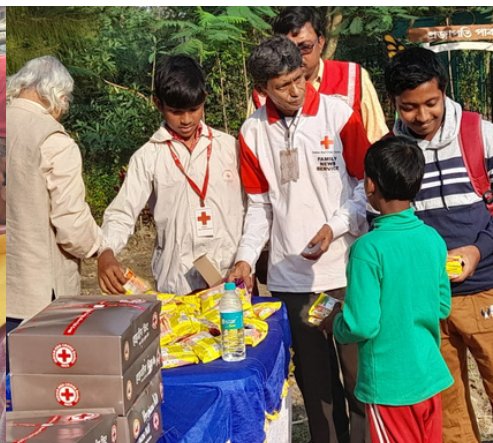
Distribution of hygiene kits & maggie packets, IRCS, Alipore, South 24 Parganas, West Bengal