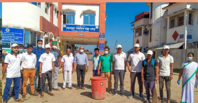
Volunteers of IRCS, Sonamura, sub-divisional branch participated in a "Swachhta Abhiyaan" at Sonamura CHC, Tripura