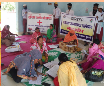
Junior Red Cross Unit, Government Higher Secondary School, Dumali, Kanker, Chhattisgarh appealed to people above 18 years of age to get their names included in the voter list