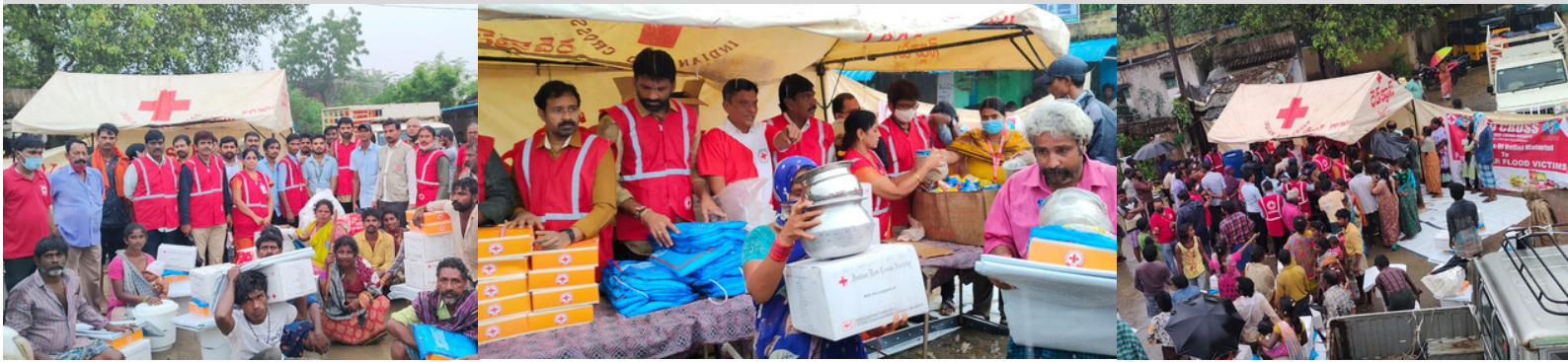
Nellore district branch in Andhra Pradesh distributed relief materials consisting of kitchen sets (18 types of steel items, aluminum utensils), tarpaulins, mosquito nets, plastic buckets and hygiene kits to 60 needy families.