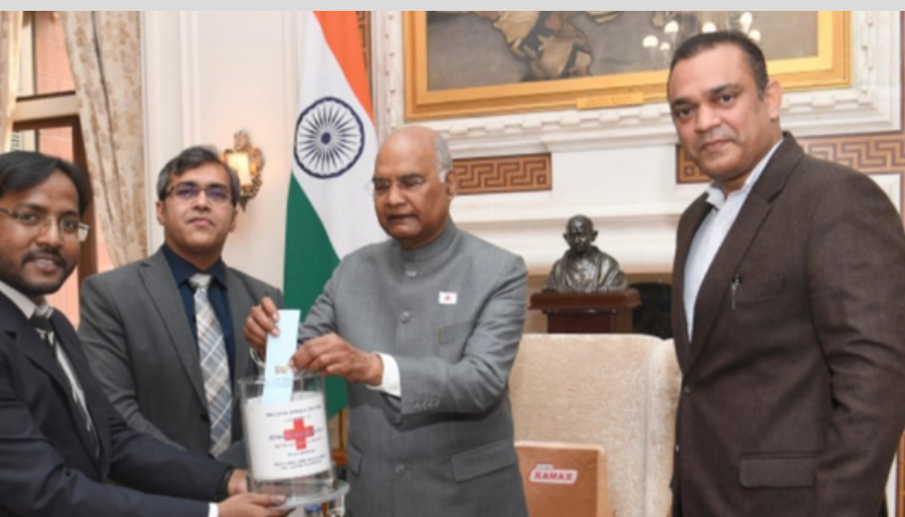
Delegation of Indian Red Cross Society, Delhi Branch called on Hon'ble President of India & President of IRCS, NHQ Sh. Ram Nath Kovind at Rashtrapati Bhawan on the occasion of Red Cross Flag week. A flag was pinned & donation was collected.