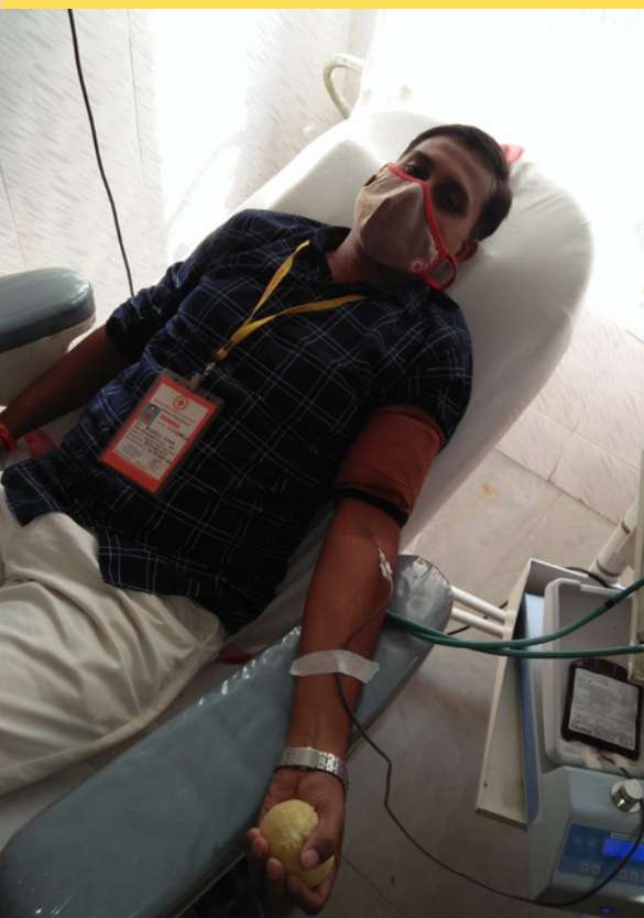
Blood donation, Tripura