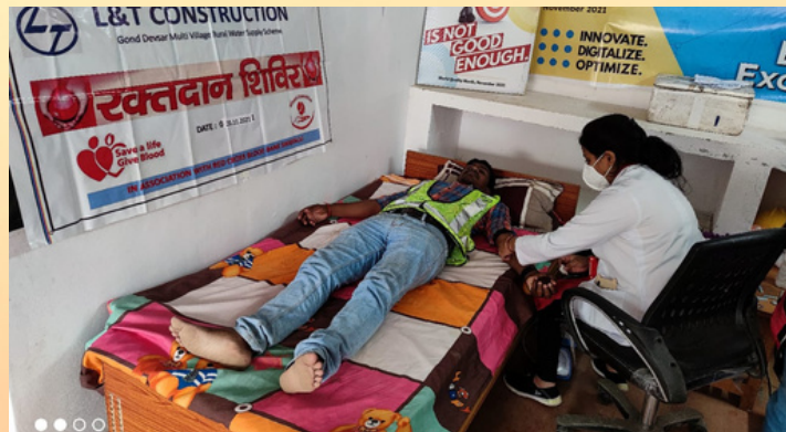
Blood donation camp was organized by L & T Sarai, Singrauli, M.P