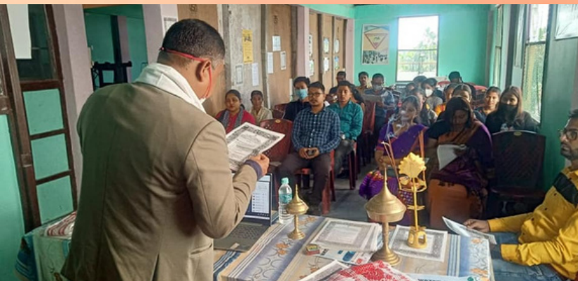
Nehru Yuva Kendra (Govt. of India), Udalguri in collaboration with District Legal Services Authority, Udalguri; Indian Red Cross Society, Udalguri and MRSD NGO Udalguri organised a programme to celebrate the Constitution Day at Udalguri, Assam