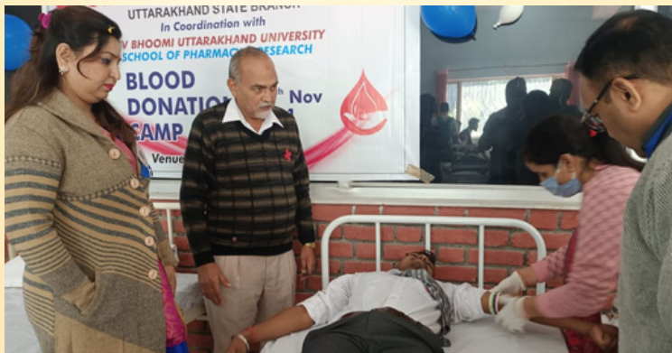
Blood donation camp was organized by IRCS, Uttarakhand state branch in collaboration with Dev Bhoomi Institute Dehradun. 110 Units of Blood was collected.