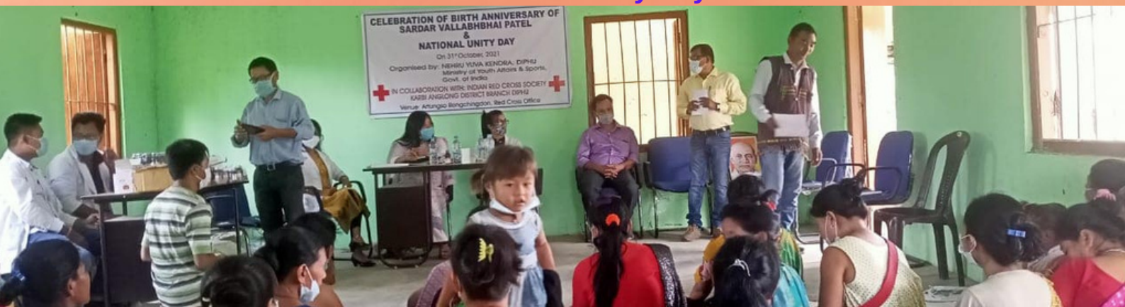
As a part of nationwide celebration of National Unity Day to commemorate the birth anniversary of Sardar Vallabhbhai Patel, the Karbi Anglong district branch of IRCS in collaboration with Nehru Yuva Kendra organised a free health check-up & vaccination awareness camp. Free medicines were also distributed during the program.