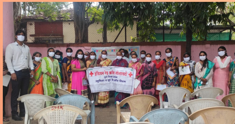
World Toilet Day celebration by IRCS, Pune, Maharashtra