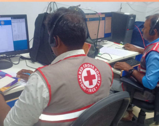
State Emergency Operation Centre of Tamil Nadu was assisted by RC volunteers