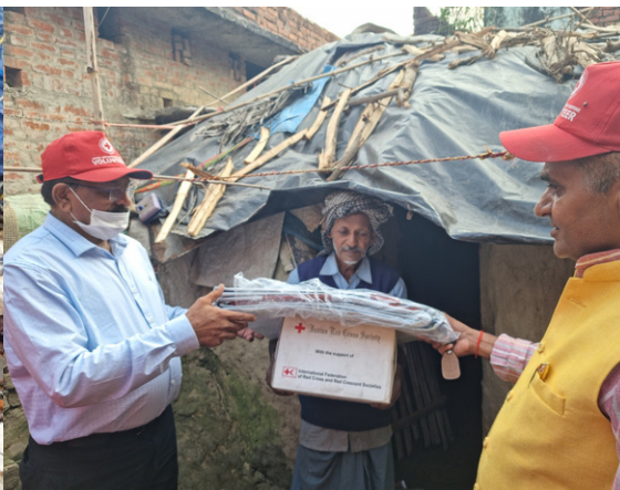
IRCS, Deoria, U.P distributed flood relief material